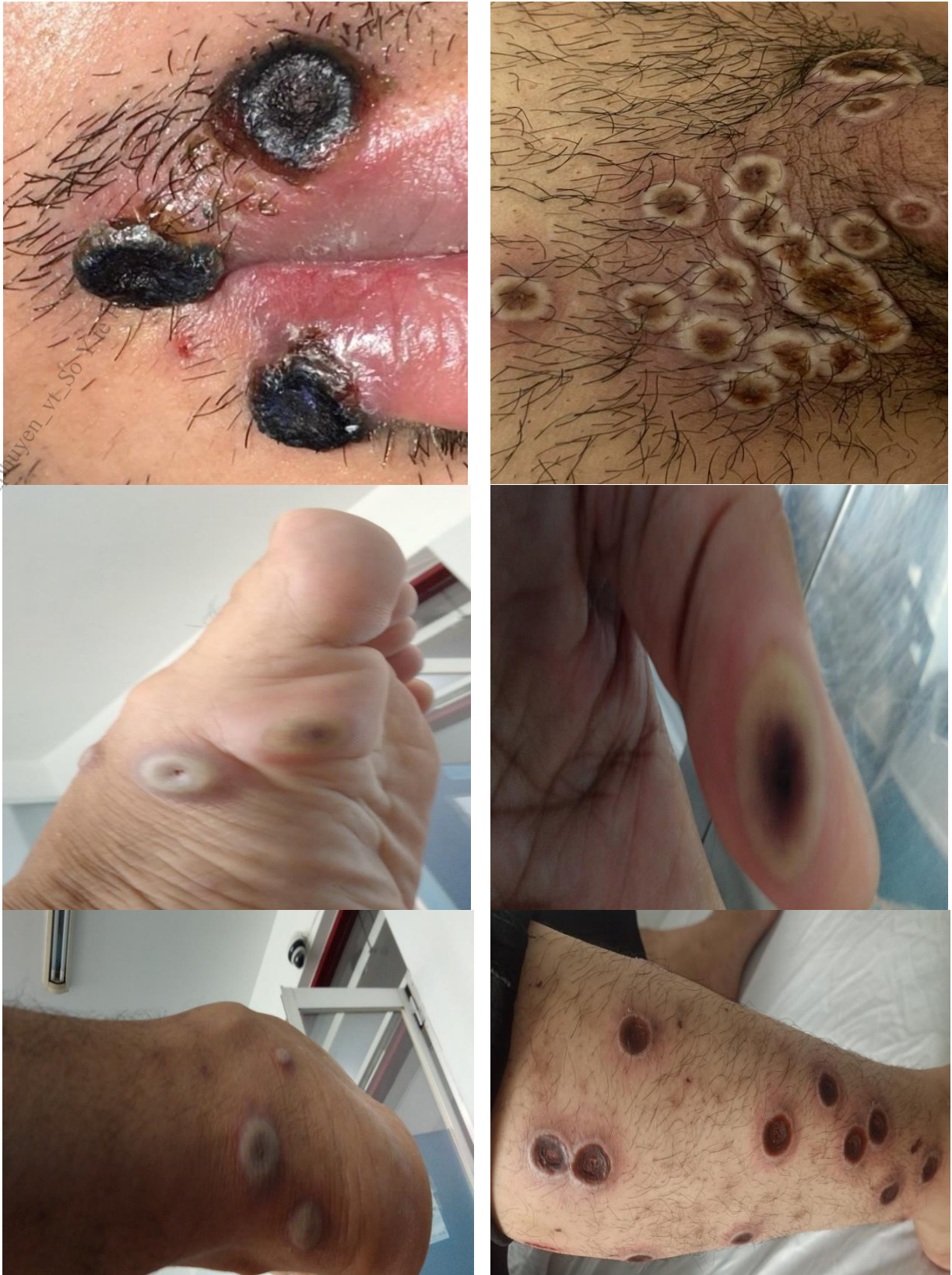
Hình 2. Hình ảnh tổn thương sâu