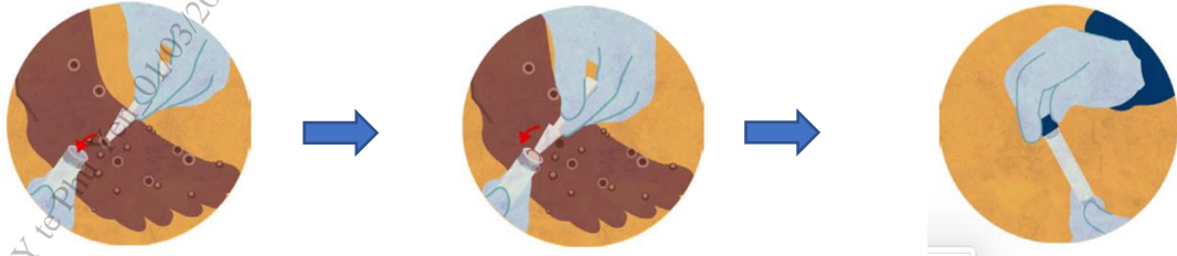
Hình ảnh minh họa về lấy mẫu da/vảy khô từ vết tổn thương

thương): sử dụng panh kẹp hoặc dụng cụ gấp (có đầu không sắc) vô trùng để gấp toàn bộ hay một phần da/vảy khô (kích thước ít nhất 4mmx4mm) rồi cho vào ống vô trùng (ống 1,5ml hoặc ống 5ml) không chứa môi trường vận chuyển. Sử dụng băng cá nhân để băng lại vết thương sau khi lấy mẫu.